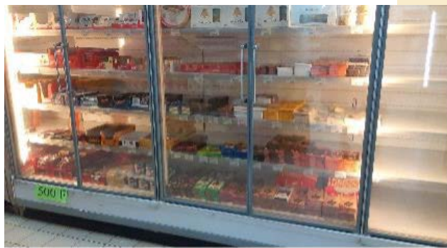
冷蔵庫に陳列されるチョコレート達