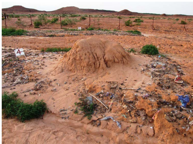
「愛の巣」の盛り上がり——緑化実験ではゴミを投入して2年(2回の雨季)が経過するとシロアリ塚は直径230cm、高さ65cmに成長しました(2010年8月)

7月になって雨が本格的に降り出し、住民たちがその土壌にトウジンビエの種子を播種すれば、10月中旬には収穫し、食料とすることもできます。雨季が到来するまえにゴミを荒廃地に投入し、シロアリの女王様と王様に「愛の巣」の材料を準備しておくことが、ニジェールにおける緑化の第一歩となるのです。