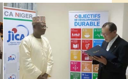
修了証書授与式の様子