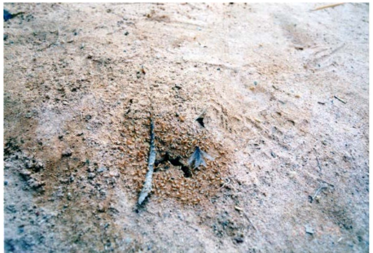
巣穴から飛び出していく羽アリ——働きアリや兵隊アリの護衛を受けます。

ニジェールで雨が降り出すと、夕暮れどきに、シロアリの群飛がみられるようになります。ニアメ市内でも、郊外の農村でも、地中の巣穴から無数の羽アリが地上に現れ、空へむけて飛び出していきます。この羽アリにはオスとメスがあり、女王アリと王様アリの候補です。羽アリが出てくる巣穴の周囲には大勢の働きアリや兵隊アリが群がっており、敵の襲撃にそなえて厳重に警護するとともに、新しい女王と王様アリの門出を祝っているようにも見えます。