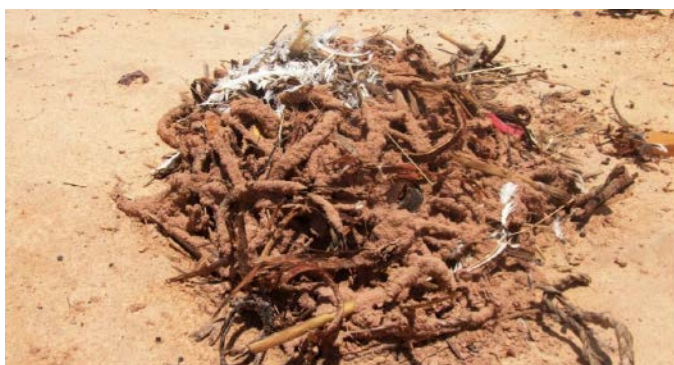
荒廃地に捨てられたヤシ繊維のロープーシロアリのシェルターに包まれていく。

ペアになった羽アリがゴミに定着すれば、荒廃地の固い岩盤は農業に適した土壌に変化します。シロアリはみずからの唾液を使って、粒子の大きい砂や、細かなシルトや粘土の粒子をつなぎあわせ、植物の枝やわら、葉などを包むように、シェルターをつくっていきます。ちょっとした衝撃や雨粒によって、このシェルターは簡単に壊れてしましますが、土壌の粒子がゆるやかに結合し、空隙の多い団粒構造が形成されます。この団粒構造ができれば、空隙が空気や水を含むので、植物の根は伸張しやすくなります。