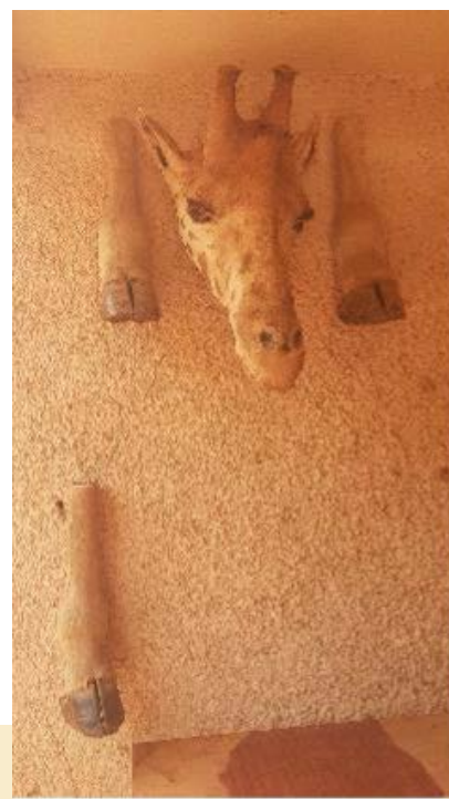
頭と足だけのキリン