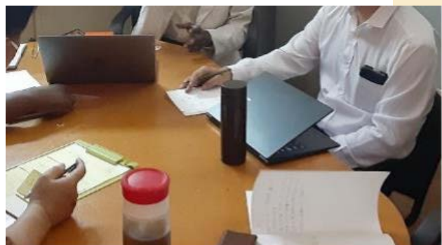
打合せ時のテーブルにも水筒