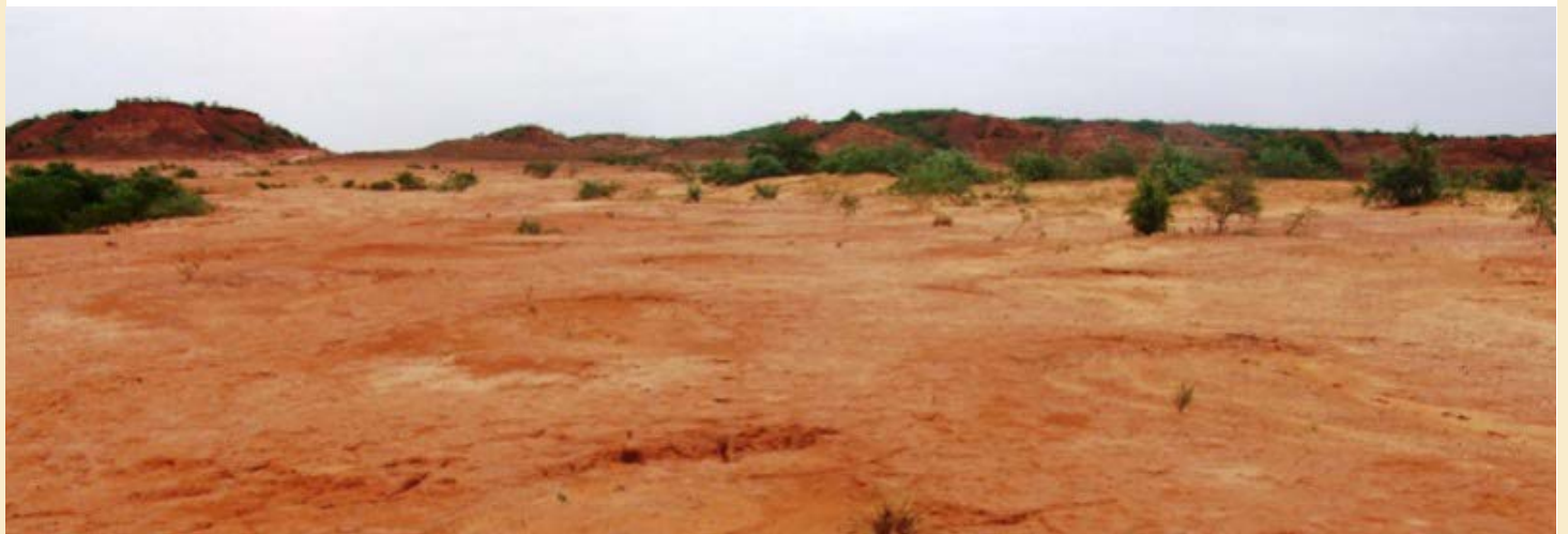
砂漠化の進んだ固い岩盤——砂漠化の影響は人間だけでなく、シロアリにも影響を及ぼします。固い岩盤では、羽シロアリは地中にもぐることはできないし、近隣に餌となる植物バイオマスも少ない。

て子を産み、コロニーを作っていきます。運悪く、固い岩盤のうえに落下してしまうと、ペアの2匹はさまよいつづけ、地面を掘って地中に入れないこともあります。また、クロアリに捕まって、餌として引きずられていく、ざんねんなペアもいます。農村の内部やその周辺では、飼育されているニワトリとホロホロ鳥が忙しく、着地した羽アリをついばんでいることもあります。とてもシビアで、残酷な世界です。