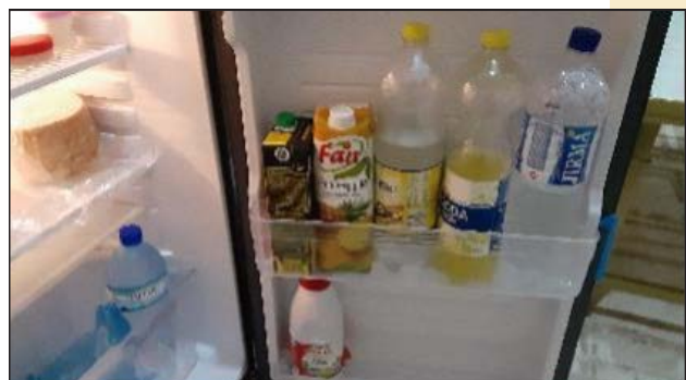
ある日の冷蔵庫内