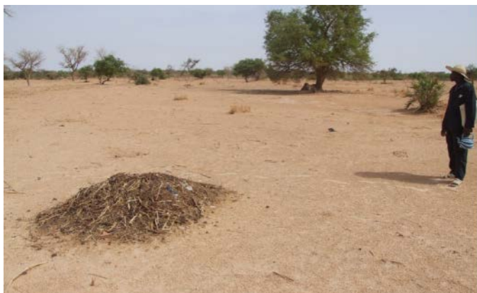
広大な荒廃地に投入されたゴミ——畑に転換するにはゴミの量は不足しますが、羽アリの誘引と定着をうながすには、まずは十分です。

農村の住民のなかには、荒廃地を畑に転換しようとするとき、ゴミをちょっとだけ、気まぐれのように置いておく人がいます。手元にゴミがなく、多大な労力をかけることもできないため、全面に大量のゴミをまくことができないという農村に住む人々の事情もあるのですが、住民は土壌を改善するシロアリの重要性を心得ていて、群飛で飛んでくるシロアリを誘引するのです。毎年、すこしずつゴミを投入し、シロアリの力を借りて、耕作地の土壌改善をつづけていきますが、耕作地を拡大するという目的を達成できず、気まぐれのまま終わってしまうことも多いのです。