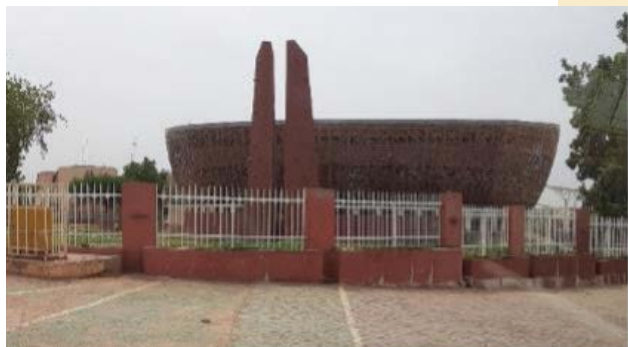
マハトマ・ガンジー国際会議場 (庭にはガンジーの銅像もあります)